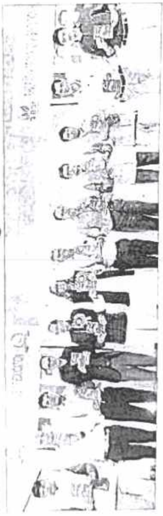
राष्ट्रीय सागर सवादनदाता